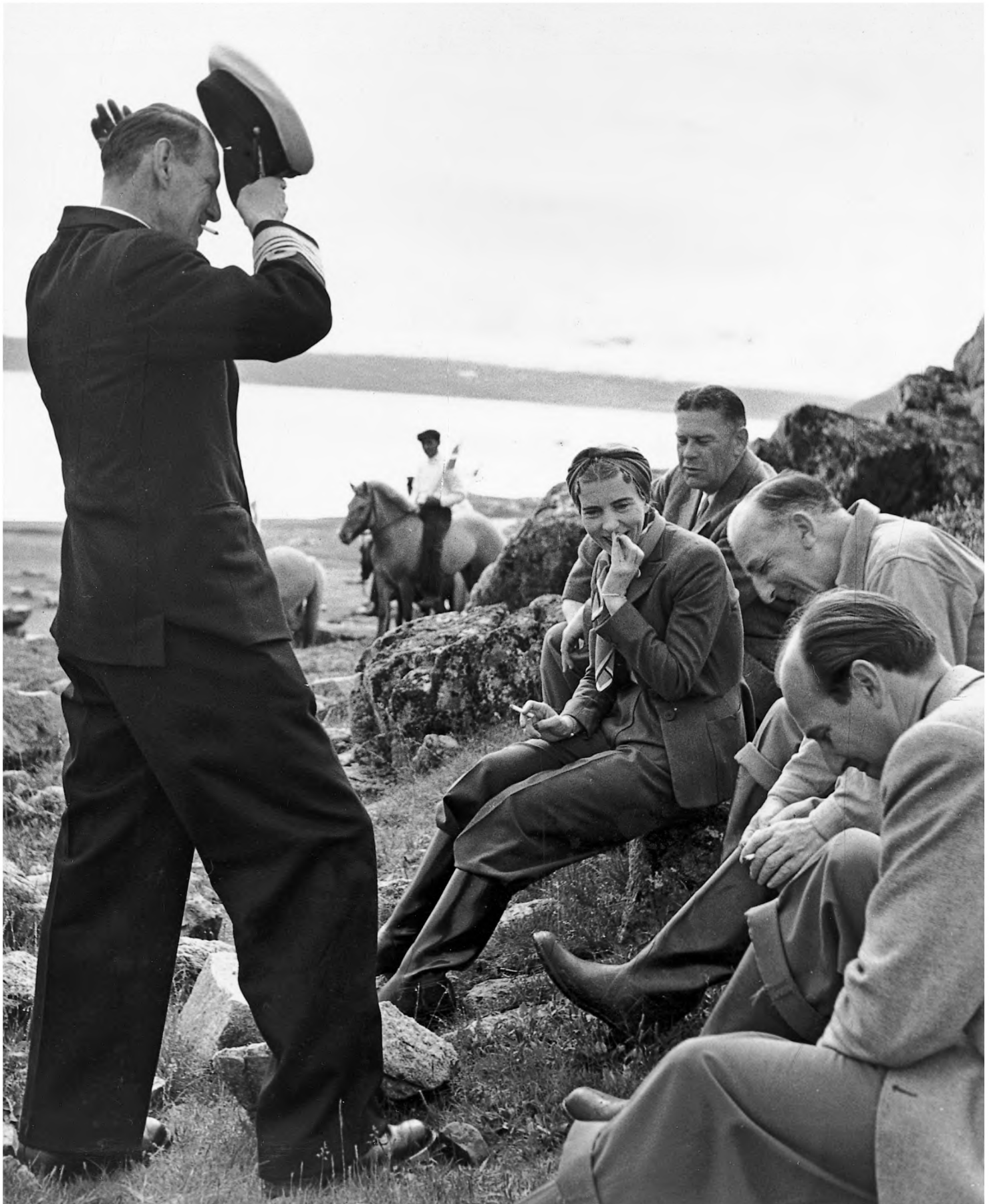
Hvil i fjeldet nær Igaliku. Bemærk rytteren på den lille islandske hest i baggrunden. Vi er her i de gamle nordboers land, så langt mod syd, at traditionelt landbrug og husdyrhold – i hovedsagen får – er muligt.