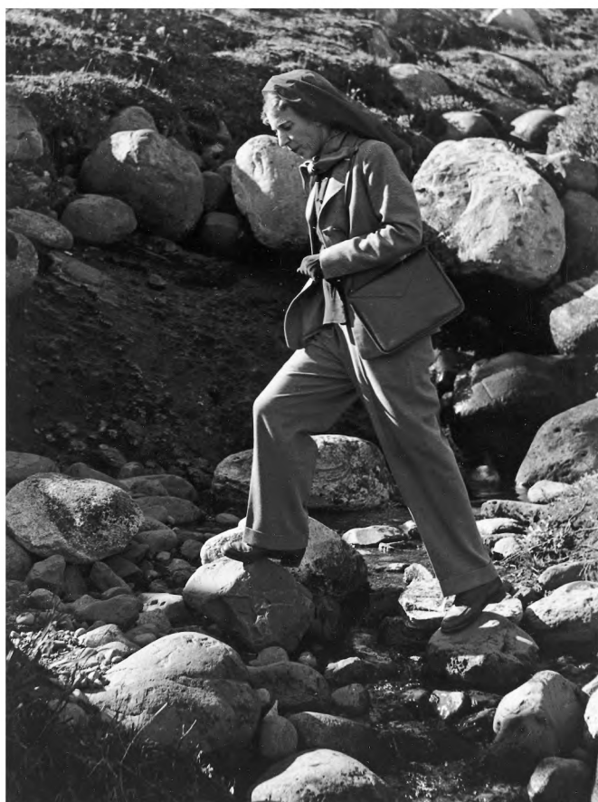
Dronning Ingrid på fjeldvandring under besøget i Godhavn/Qeqertarsuaq på Diskøen, der var hovedsæde for den vestgrønlandske koloniadministration. Man skal vare sine skridt i den vildsome grønlandske natur; men Dronningen var på dette tidspunkt en sportstrænet yngre kvinde på 42 år, som i mere end én forstand fuldt ud forstod at vare sine skridt.