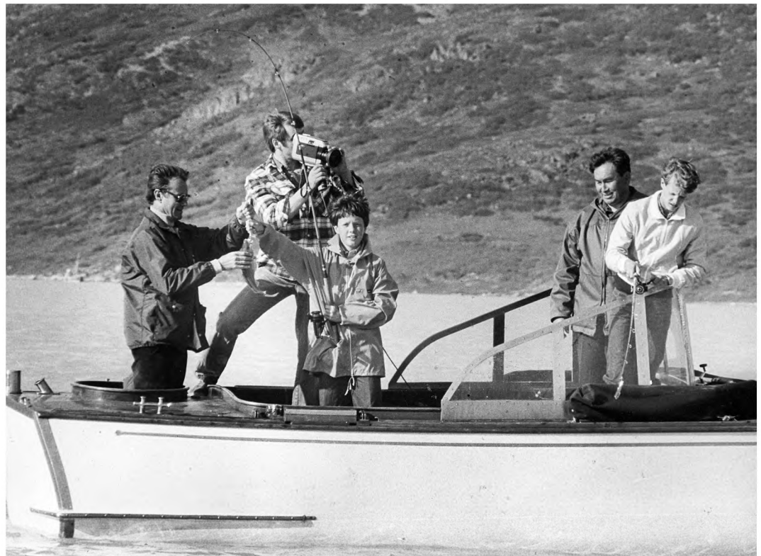
Som led i markeringen af 1000-året for Erik den Rødes ankomst til Grønland i 982 var regentparret atter på besøg, for første gang ledsaget af deres to sønner. Under opholdet i Narsarsuaq benyttede Prins Henrik og de unge prinser lejligheden til at tage ud på en fisketur, der efter sigende indbragte ikke færre end et halvt hundrede store torsk på næsten ingen tid.